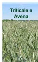
Triticale e Avena